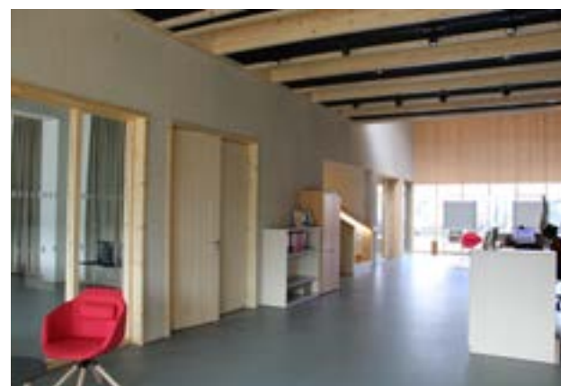
Hall d'accueil du nouvel hôtel de ville desservant l'agence postale, le service état-civil, le CCAS.

Les services administratifs et l'agence postale vous accueillent désormais au 2 rue Saint Jean dans le nouvel hôtel de ville.